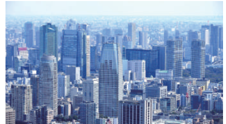
生活財産を守る建物の防水資材・塗装材・内外装材販売