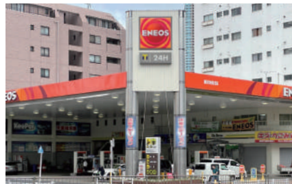
Dr. Drive月島SS (外観)