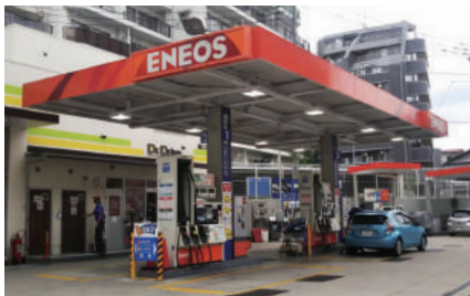
Dr. Driveセルブ下落合駅前SS (外観)