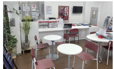
Dr. Drive月島SS (セールスルーム)