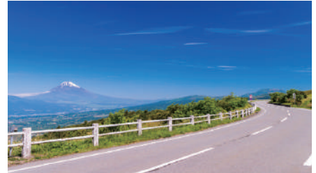
道路舗装にかかせないストレートアスファルト、改質アスファルト販売